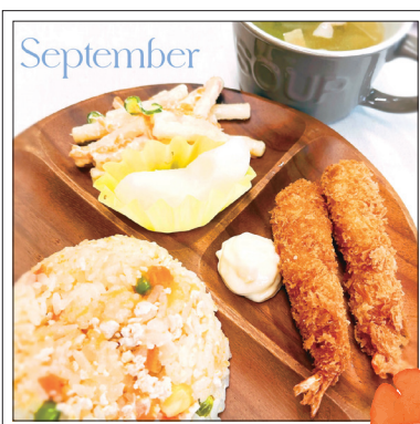
9月お誕生日会：キャロットピラフ、エビフライ、マカロニサラダ、ベーコンのスープ、梨