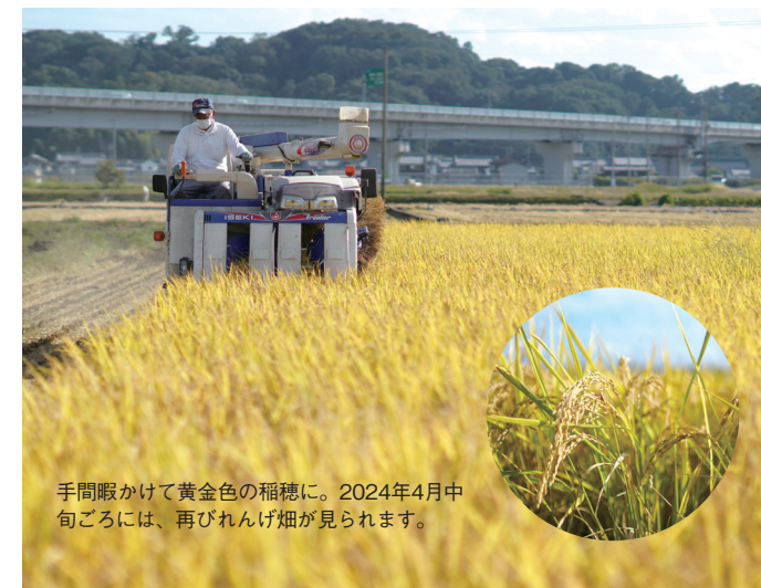
手間暇かけて黄金色の稲穂に。2024年4月中旬ごろには、再びれんげ畑が見られます。