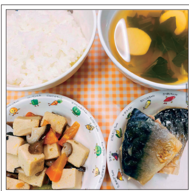
10月給食より：ごはん、さばの塩焼き、高野豆腐と野菜の煮物、小松菜と里芋のすまし汁