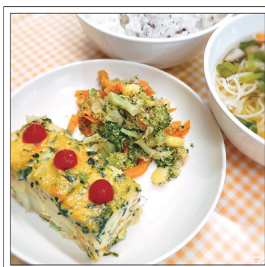
9月給食より：ゆかりごはん、ツナとほうれん草のオムレツ、ブロッコリーのおかか和え、にゅうめん