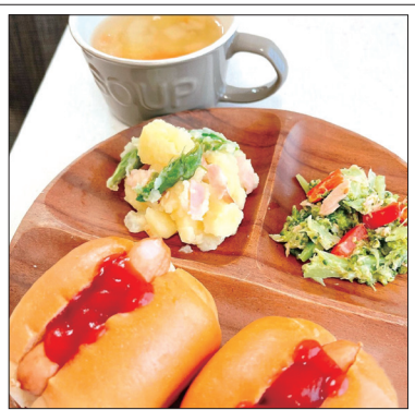
5月お誕生日会：ウインナードッグ、アスパラ入りジャーマンポテト、ブロッコリーとツナのサラダ、白米とマカロニのカレースープ