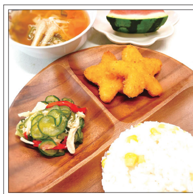
七夕：とうもろこしごはん、星のコロッケ、きゅうりのささみ和え、天の川にゅうめん、すいか