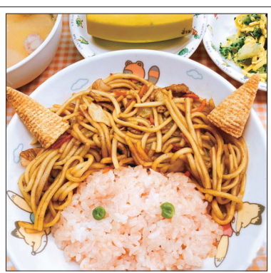
節分：もじゃもじゃ頭の鬼ライス、かみなりサラダ、大豆とごごろ野菜のスープ、バナナ