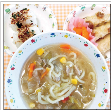
10月給食より：ふりかけごはん、みそラーメン、ちくわのチーズ揚げ、みかん缶