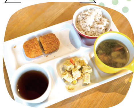
11月給食より：もち麦ごはん、かつおカツ、高野豆腐の卵とじ、小松菜と揚げの味噌汁