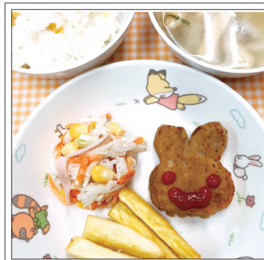
お月見：栗ごはん、うさぎ型ハンバーグ、さつまいもステーキ、切干大根のコールスローサラダ、里芋と揚げの味噌汁