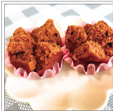
9月おやつより：ココア蒸しパン