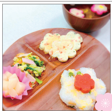
ひなまつり：お花のちらし寿司、ふんわり花型豆腐、菜の花とハムの和え物、花魁のすまし汁、白桃缶