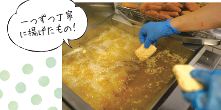
一つずつ丁寧に揚げたもの！