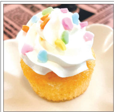
5月お誕生日会のおやつ：デコレーションマフィン