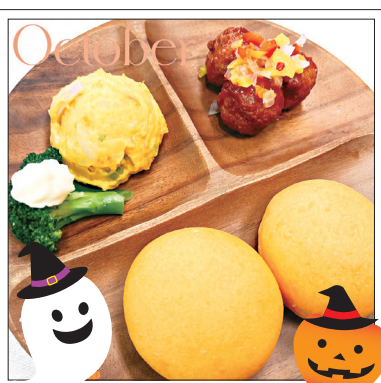
10月お誕生日会：ベジロール、彩り野菜のミートボール、かぼちゃのサラダ、ブロッコリー添え、ABCスープ