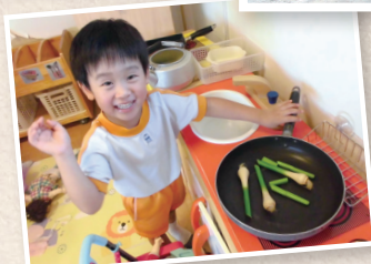
料理名人も誕生! のびのびと自己表現をし、自分に自信を持つ子が増えました。