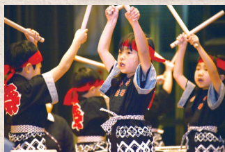
全身で太鼓の音を感じ、リズムに合わせて気持ちよさそうに演奏する子どもたち。

約10年前から特定非営利活動法人（NPO法人）和太鼓教育研究所の講師を招き、5歳児クラスを対象に和太鼓活動を実施。太鼓を叩くと体幹が鍛えられるため、正しい姿勢につながり、リズム感も養われます。練習を重ね、生活発表会では先生も一緒に演奏してよい思い出に。保護者からは「子どもが心から楽しんでいる」と好評です。