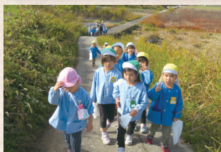
異年齢児との交流は、特に一人っ子や未っ子の保護者から「ありがたい」と好評です。

小さい子はかわいいので仲よくしようと思う 一緒にどんぐりを拾ったのが思い出 お兄ちゃんお姉ちゃんと遊べるから楽しみ 何しようかな?と思うとワクワク♪ イス取りゲームで盛り上がったよ