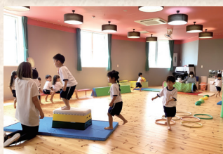
廊下からの見通しがいよいホールで体育遊び。雨の日でも思いっきり体を動かせます。

お部屋のなかがかキレイで色も素敵♪ オシャレな階段が好き! 2階の教室の窓からお庭がいっぱい見える 遊ば場所がいっぱいある 最初に入ったときスゴイ!!と思った