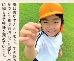
春は蝶やてんとう虫も。生き物を見つけて喜ぶ気持ちに共感し、皆に知らせて興味を深めています。