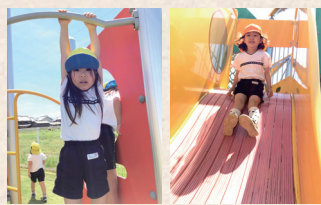
幅の広い滑り台は2人で滑ることも可能。地面には安全マットを敷き詰めています。