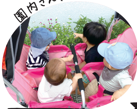
鶴舞やまとこども園

ベビーカーに乗って園内を巡る0歳児は、桜の花を指差したり、たんぼの花を摘んで観察したり、手ざわりを確かめたり。乳児から日常的に四季の自然に親しみます。